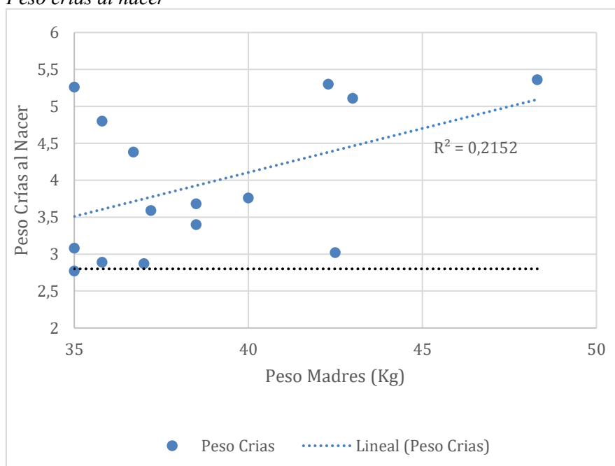
Tabla 4 Peso crías al nacer

En factores como la edad del animal condición corporal y si es un parto único o múltiple.