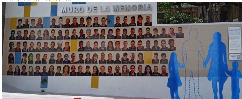
Muro de la memoria