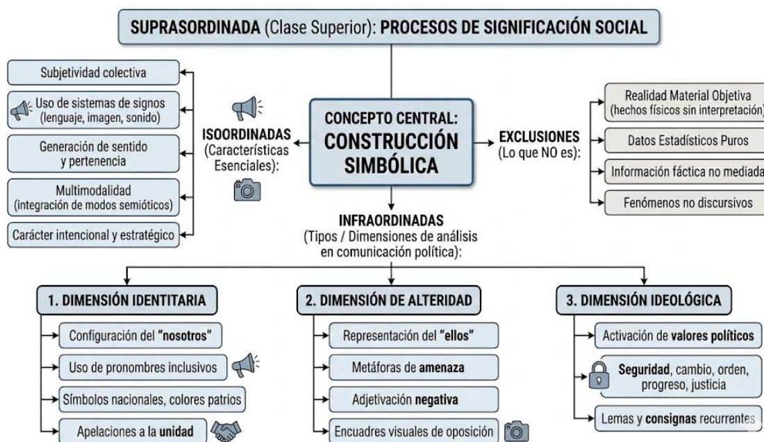
Figura 1 Matriz de análisis hermenéutico

Para este proceso, se debe tener una categoría principal a partir de la cual partir el análisis. La categoría central, Construcción simbólica y discursiva de la Consulta Popular en entorno digital (Figura 1), facilita el análisis de cómo la campaña genera significados políticos mediante elementos lingüísticos, audiovisuales y visuales en plataformas digitales.